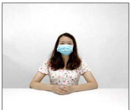
图2：正前方第一机位效果图