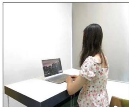
图3：侧后方第二机位效果图