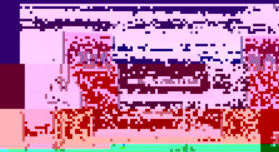
教育学院2010年度学术交流会现场

会议第三阶段为各系系主任或代表汇报，由系主任汇报本系的发展规划，重点汇报了本系在2010年度学术成果在《中国教育报》发表情况。